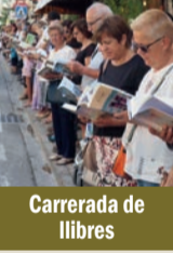
Carrerada de llibres