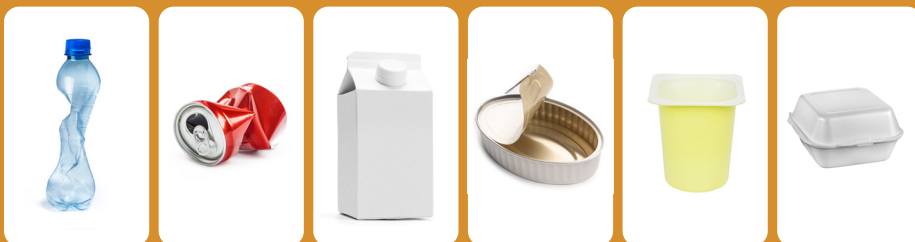
Ampolla de plàstic