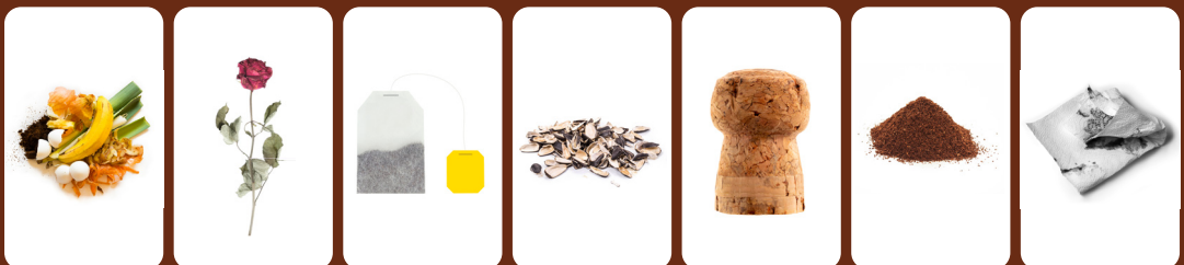
Restes de menjar