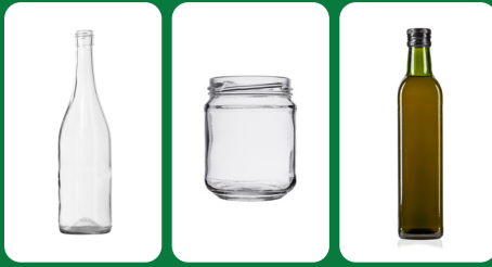
Ampolla de vidre